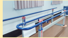
● 機能訓練スペース