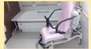
● 浴室 (機械浴 (1F))