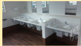
● 洗面 (車椅子対応)