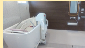
● 浴室 (機械浴 (1F))