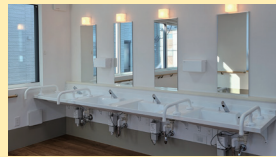
● 洗面 (車椅子対応)