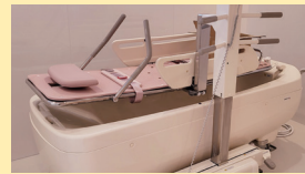
● 浴室 (機械浴 (1F))