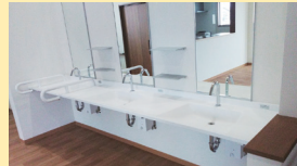
● 洗面 (車椅子対応)