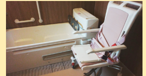
● 浴室 (機械浴 (2F))