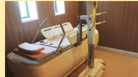
● 浴室 (機械浴 (1F))