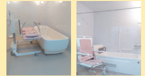
● 浴室 (機械浴)