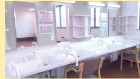
● 洗面 (車椅子対応)