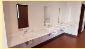
● 洗面 (車椅子対応)