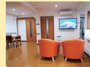
●大型テレビが鑑賞できるラウンジ