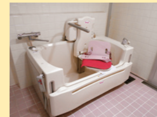
●機械浴対応の浴室