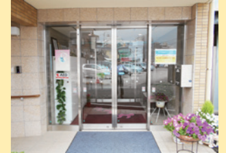
●バリアフリーのエントランス