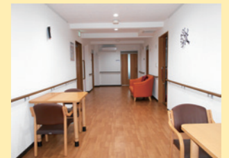
●ゆったりとした廊下