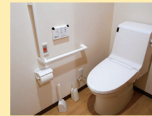
●温水洗浄暖房便座付トイレ

緊急通報装置（ナースコール） 専有部の居室、トイレの他、共用部の浴室入口、トイレに設置されていて、ボタンを押すと24時間職員が対応いたします。