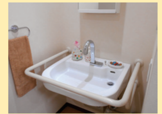
●小型電気温水器付洗面台